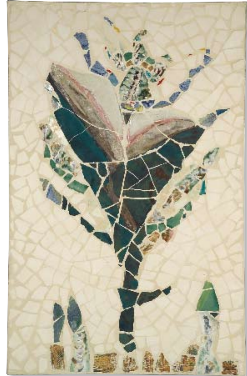
„Fließen – Bewegung – Weite I“ Mosaik 48 x 70 cm 2005