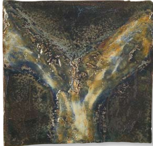
„Wachsen zur Weite“ Keramik 25 x 25 cm 2000